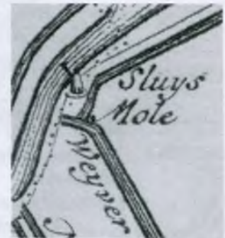
Molen H op een kaart van ca 1730.