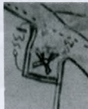
Molens F Rootges molen op een kaart van 1655.

Rond 1930 werd poldermolen F gesloopt en samen met poldermolen B en poldermolen H werd de molen verkocht aan een sloopbedrijf voor een totaalbedrag van f.1000,--.