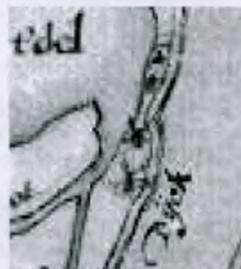
De molens C en D op een kaart van ca. 1651