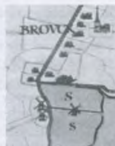
De molens C en D op een kaart van voor 1625