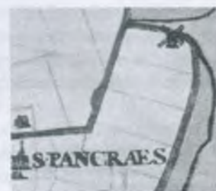
Poldermolen B op een kaart van voor 1625

Deze molen was nodig omdat een deel van de polder, de Beverkoog een onderbemaling kreeg. Via sluisjes fungeerde de molen zowel als onderbemaling voor de Beverkoog als bemaling voor de Geestmerambacht.