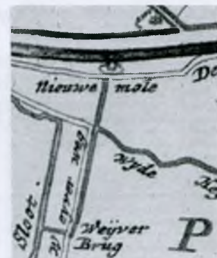
Poldermolen B op een kaart van 1745

Rond 1930 werd poldermolen B gesloopt en samen met poldermolen F en poldermolen H werd de molen verkocht aan een sloopbedrijf voor een totaalbedrag van f.1000,--.