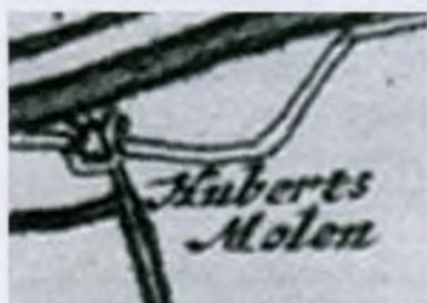
Molens E Huberts molen op een kaart van 1745.